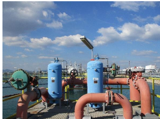
Fire Water Accumulator