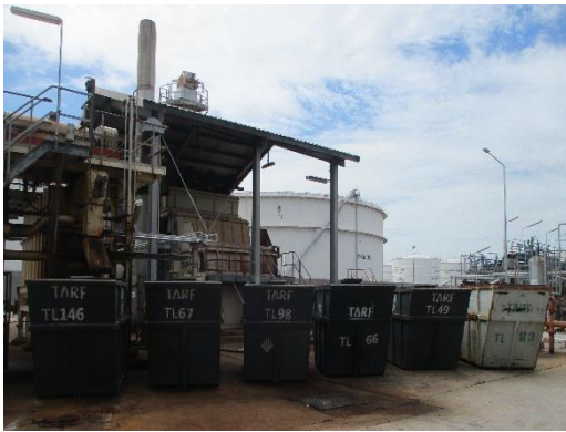
รูปที่ 3-7 ภาพขณะจัดเก็บกากตะกอนปนเปื้อนน้ำมัน