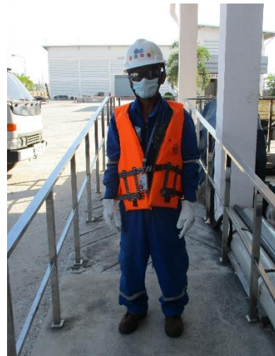
รูปที่ 3-11 พนักงานสวมใส่อุปกรณ์คุ้มครองความปลอดภัยส่วนบุคคล