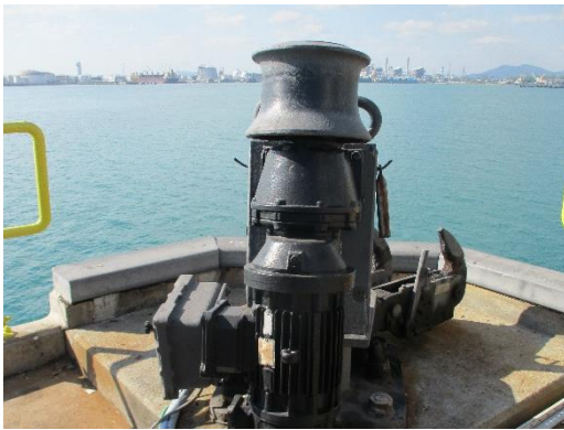
รูปที่ 3-9 อุปกรณ์ยึดเรือ