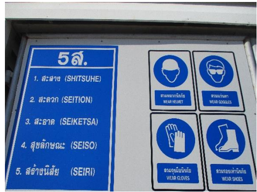
รูปที่ 3-10 ป้ายเตือนให้พนักงานสวมใส่อุปกรณ์คุ้มครองความปลอดภัยส่วนบุคคล