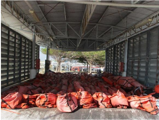
Rapid deploy boom