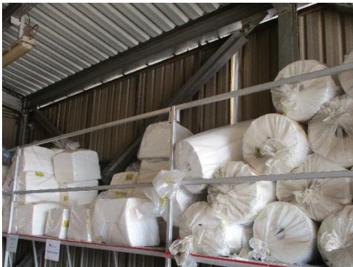
Oil Sorbent Pads