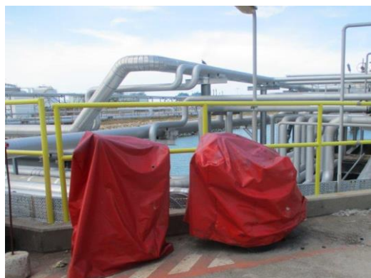
Form Cart and Wheel Dry