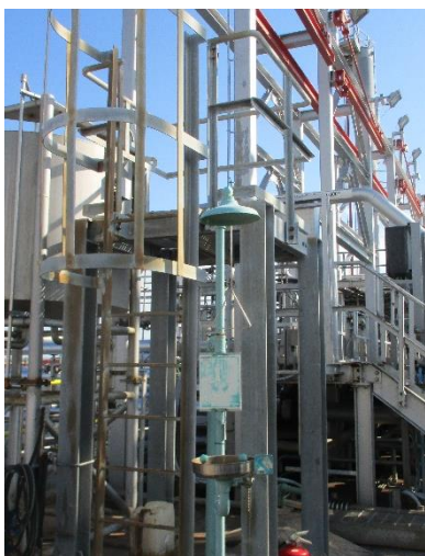
Emergency Shower & Eye/Face Washer