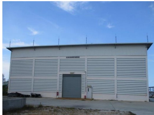
Oil Spill Equipment Warehouse