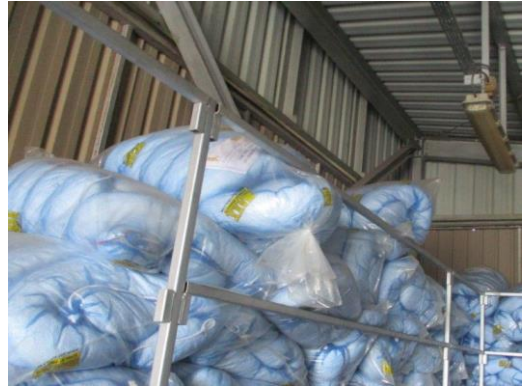
Oil Sorbent Booms